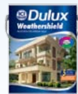
Top Coat 面漆