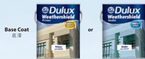
Base Coat 底漆

Untuk mendapatkan kesempurnaan hasil mengecat, guna Dulux Weathershield dengan teknologi Colourlock, bersama dengan Dulux Weathershield Primer atau Dulux Weathershield Sealer. Dengan kombinasi ini, ianya dapat memberi perlindungan selama 5 tahun terhadap pertumbuhan kulat dan alga.